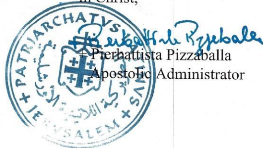
Pierbattista Pizzaballa Apostolic Administrator